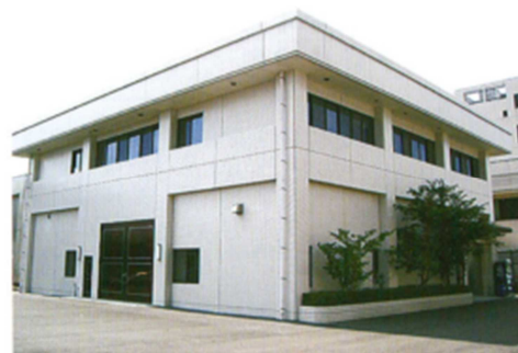
企業化支援センター外観