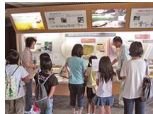
高知県紙産業技術センター