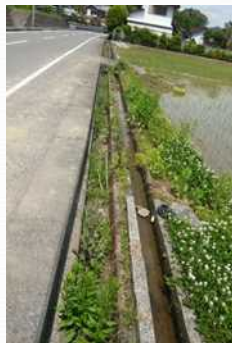
老朽化した用水路 (改修前)