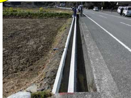
長寿命化の活動により改修された用水路 (改修後)