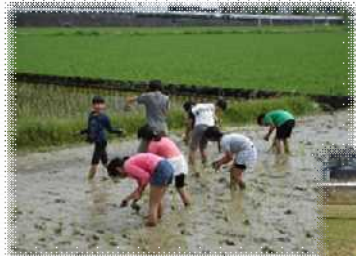
田植え体験の様子

遊休農地22.5aを利用し、地元小学生による田植えや稲刈りの農業体験を実施。また、高低差のある農用地の法面約15aを利用した花桃の植栽にも取り組んでおり、新たな憩いの場となるよう定期的に草刈りなどの管理作業を行っています。