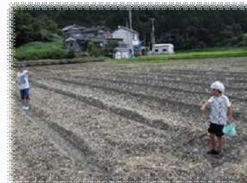
子供達とコスモスの種まき

事業開始当初から、毎年、早場米刈り取り後の田（令和元年度は1.5ha）を利用して、日高村の村花であるコスモスの植栽活動「花いっぱい運動」を地域住民やNPO法人、女性の会、村内の福祉施設の入居者等で実施しており、花の見頃である10月下旬頃に「コスモスマつり」を開催し、村内外から多くの方々（令和元年度は約1,000人程度）が訪れ、村内外の住民の交流の場となり、活動の啓発の場にもなっています。