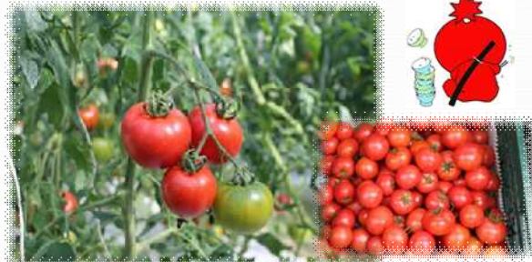
日高村特産の「シュガートマト」