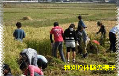
稲刈り体験の様子