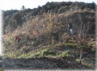
花桃植栽地の手入れ