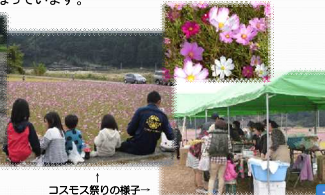
↑ コスモス祭りの様子→