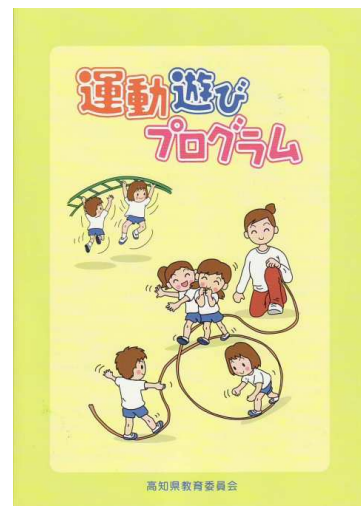
「運動遊びプログラム」冊子

また、本県の児童生徒の体力は、小学1年生段階で既に全国平均値を下回っており、幼児期における運動環境の充実も大きな課題となっています。このため、幼児が楽しみながら体を動かす中で発達段階に応じた動きを身に付けられるよう、平成23年度に作成した「運動遊びプログラム」をより有効に活用するための「運動遊びプログラム研修会」を実施するなど、幼児期における体育的活動の充実にも取り組んでいきます。