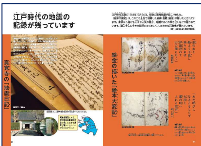
江戸時代の地震の記録(小学生用)