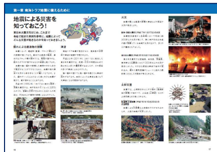
地震による災害を知っておこう! (中学生用)