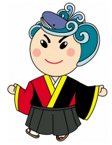
「土佐 なる子」 マスコットキャラクター