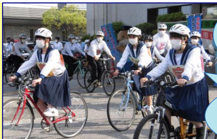
警察と連携した交通安全啓発パレードへ参加

少し頭がかゆくなったり、髪型がぐずれたりするかもしれませんが、「命に比べれば小さなこと」。