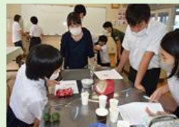
北川村保小中学校地域学校協働活動