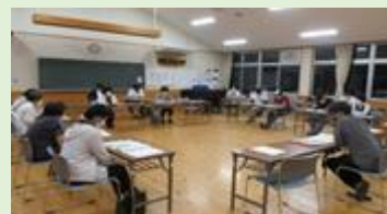
北川村保小中学校運営協議会定例会

コミュニティ・スクールと地域学校協働本部の一体的な推進では、まず、教育長を含む市町村教育委員会が小・中学校において、どのような地域学校協働活動を行っているか把握に努めることが必要です。次に、担当者の理解を一層深めるために、県が開催する地域学校協働活動研修会等により多く参加していただくよう呼びかける取組を進めていきます。