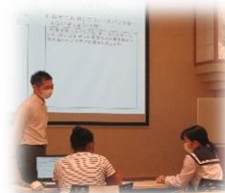
昨年度の講座の様子