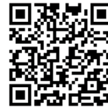
↑とさまなチャンネル

順次、動画を公開していきますので、皆様におかれましても、視聴やチャンネル登録していただくと幸いです。また、各学校や施設の取組を「とさまなチャンネル」で発信してほしい！というご要望がありましたら、ぜひご連絡ください。