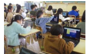
↑端末を活用した授業（小1）

※1人1台タブレット端末を「日常的」に活用した授業実践や教育活動について、ご紹介します。