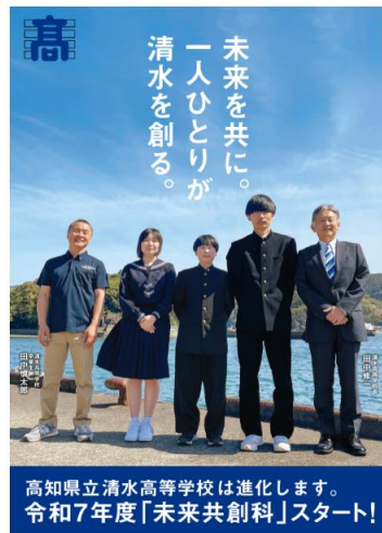
高知県立清水高等学校は進化します。令和7年度「未来共創科」スタート!