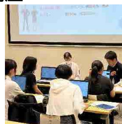
昨年度の講座の様子