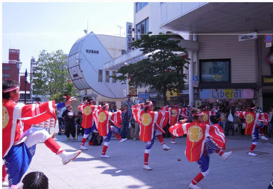
・まちなか・よさこい