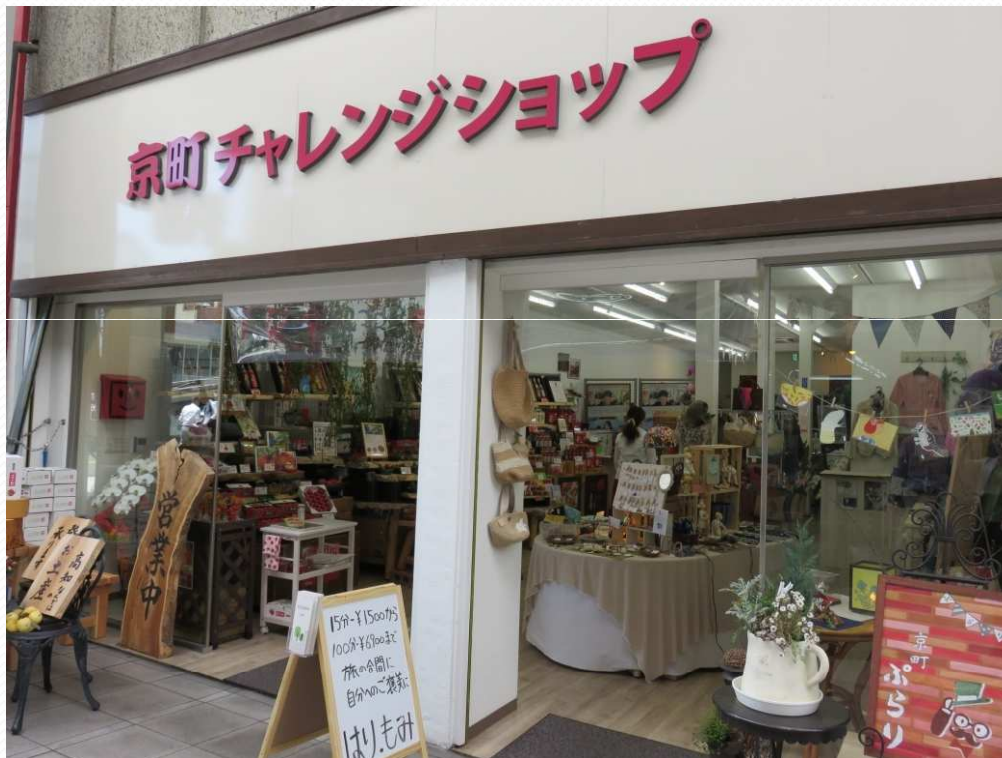
・チャレンジショップ外観