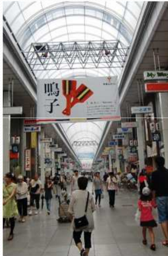
・夏フラフ演出の様子