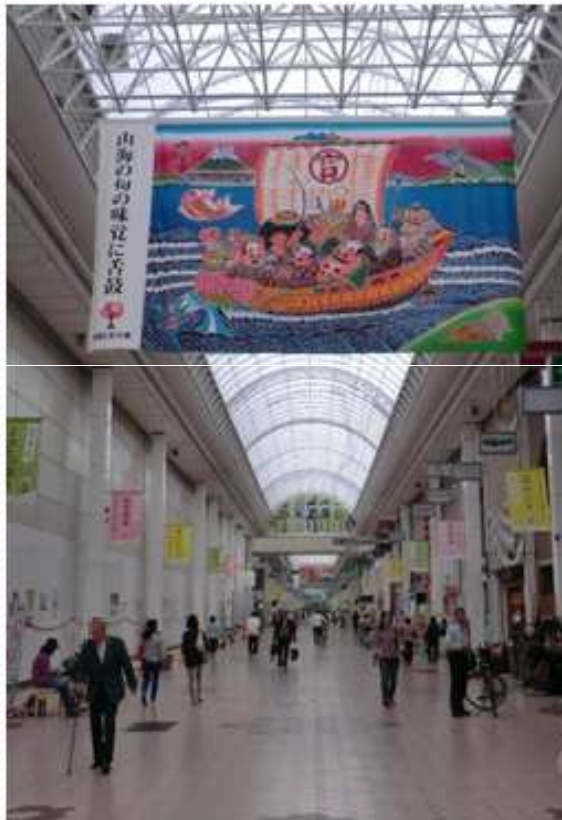
・春フラフ演出の様子