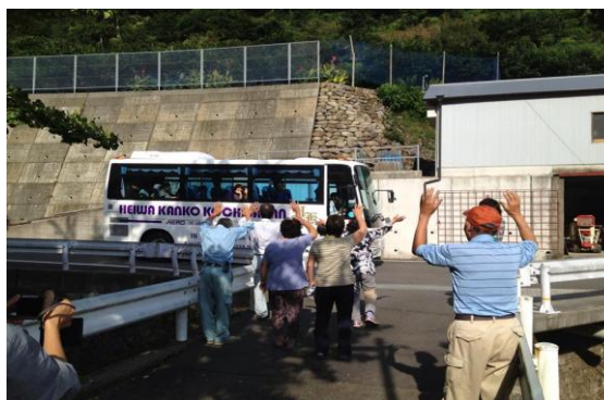
大学生を見送る地域の皆さんの様子