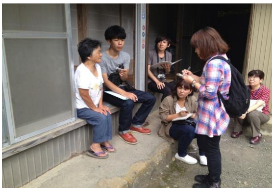
大学生による聞き取り調査の様子