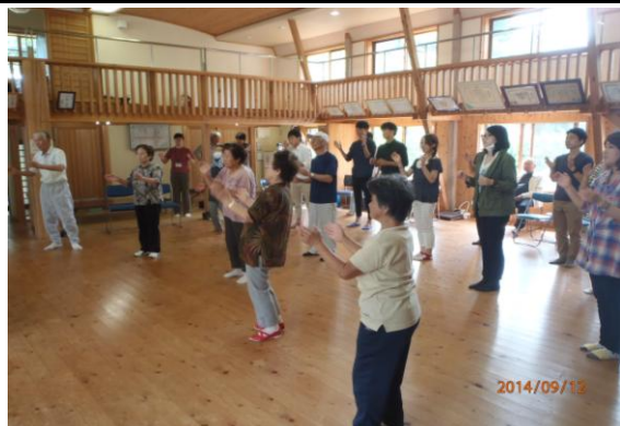
いきいき百歳体操の様子