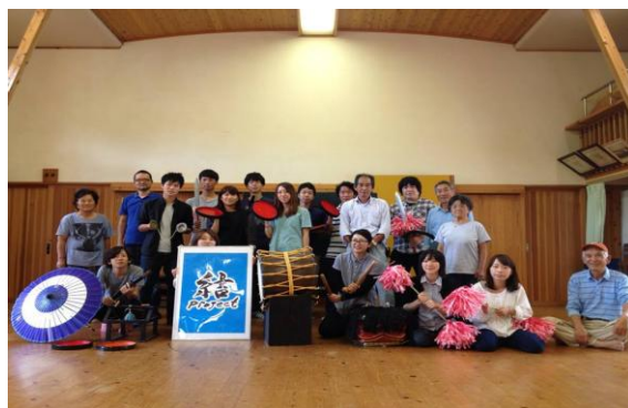
地域の住民の皆さんとの集合写真