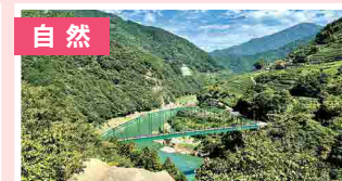
自然 豊かな自然を守ってきた住民の想い