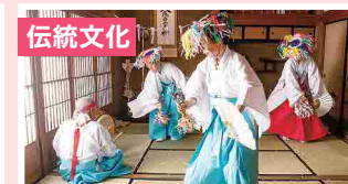
伝統文化 伝統文化を受け継ぐ地域の想い