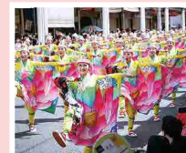
よさこい鳴子踊り

インバウンドにも訴求力のある 本県ならではの「文化」 を磨き上げ、 世界から「旅の目的地」として選ばれる県 を目指す!