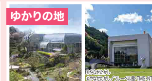
ゆかりの地 牧野博士、やなせさんの足跡