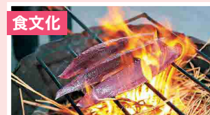
食文化 食に秘められた生産者や料理人のこだわり