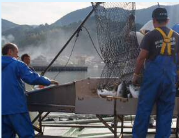
■宿毛湾ではマダイやブリ等の養殖が盛ん