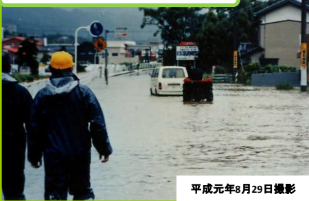
平成元年8月29日撮影