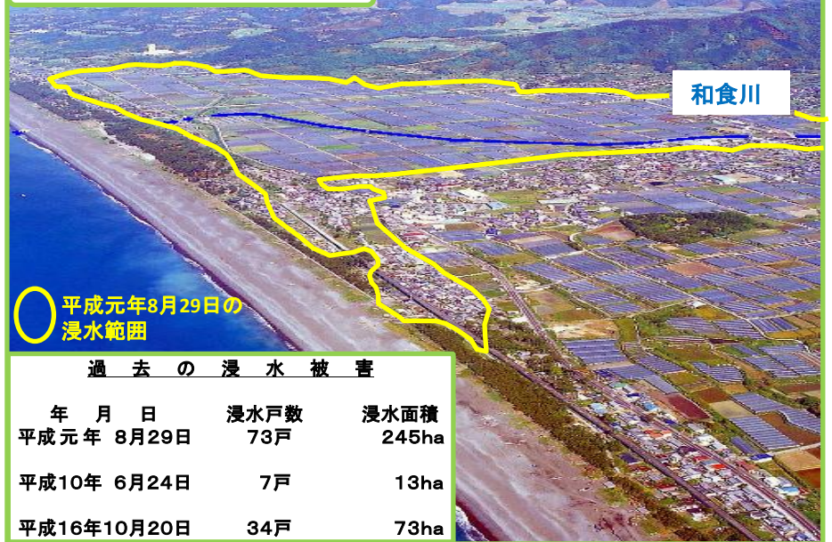
平成元年8月29日の浸水範囲