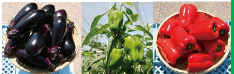
芸西村特産のピーマンとナス