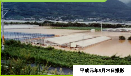
平成元年8月29日撮影