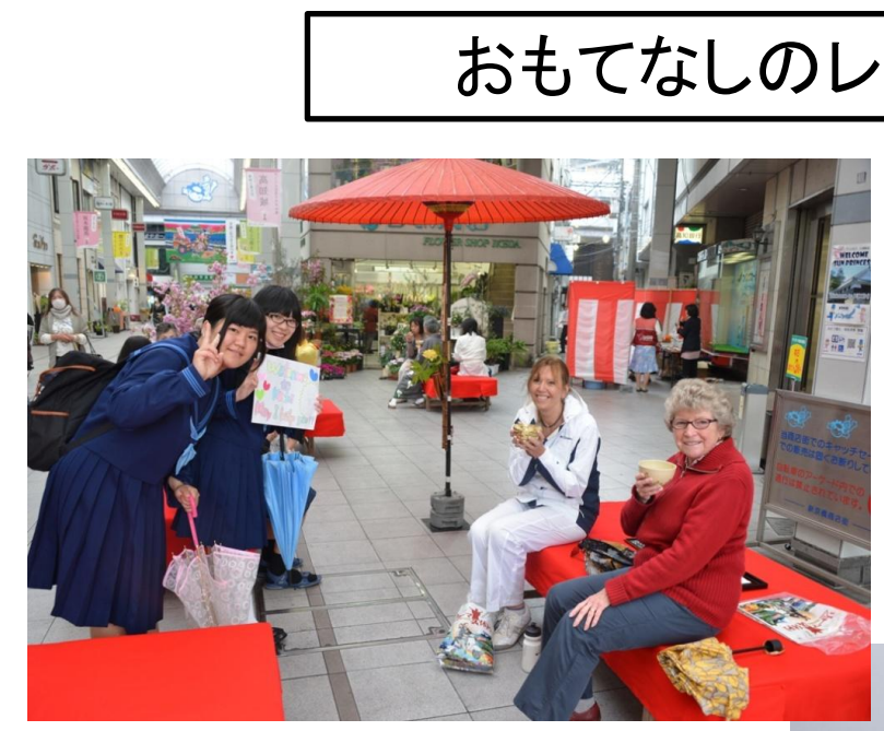
↑地元中高生とのコラボ→ 上: 英語サークルによる 通訳ボランティア 右: マーチングバンド部 による演奏(お見送り)