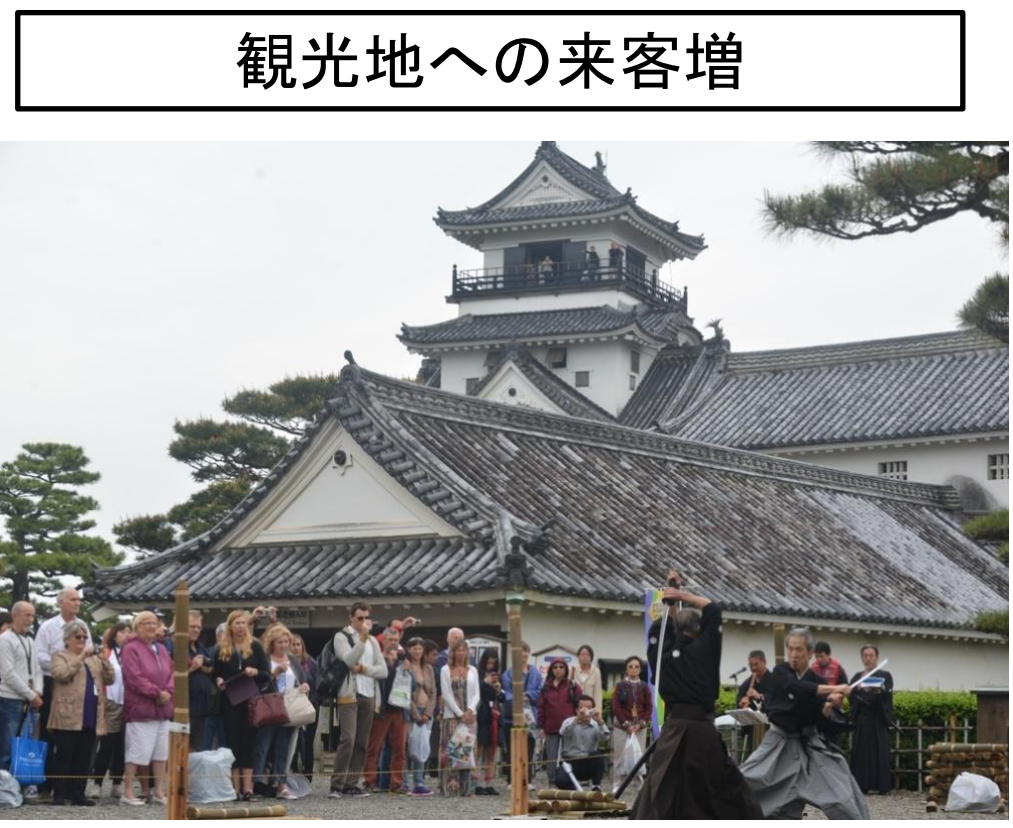
高知城での抜刀道パフォーマンス ※歴史的観光地とのコラボで好評を博す