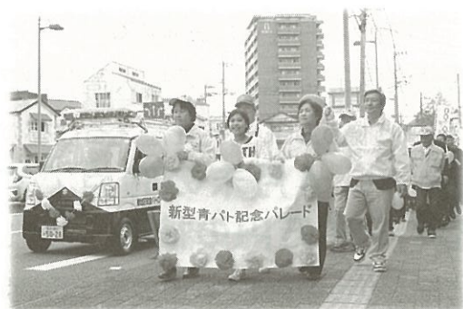
記念パレードの様子