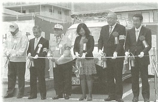
青パト出発式でテープカットを行う 葛目会長(左から2人目)ら

秦地区では、「守ろう安心・安全"秦の町"」を合言葉に、青パト活動を通して地域のみなさんが住みやすいまちづくりに取り組んでいます。