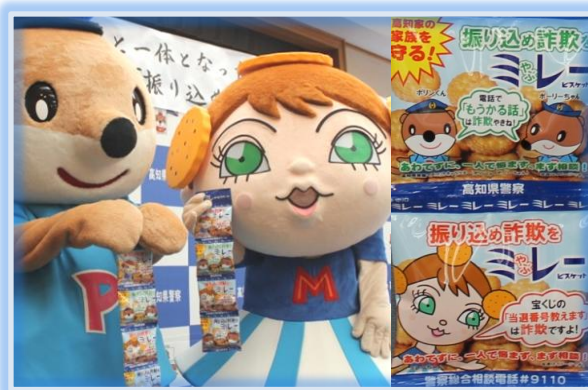
振り込め詐欺防止を呼びかけるミレービスケット

商品は4袋1セットで県内の量販店等で販売されており、売上の1%は公益社団法人高知県防犯協会に寄付され、防犯ボランティア団体の支援に充てられるとのことです。