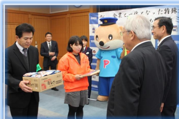
警察本部での贈呈式の模様(3月18日)