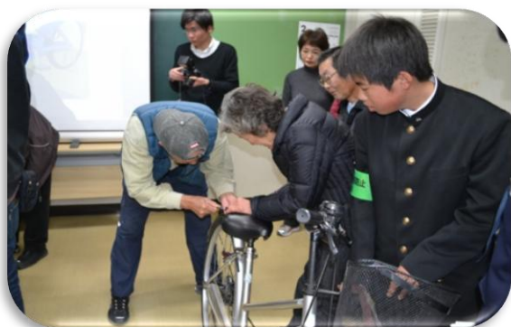
実技を通して防犯を呼びかけました