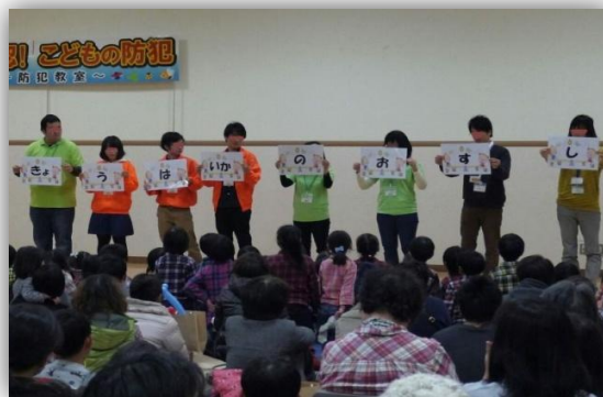
大学生ボランティアも参加しました

高知市では、「高知市安全で安心なまちづくり条例」に基づく推進体制として「高知市安全で安心なまちづくり会議」を設置しており、関係機関等と連携・協力しながら犯罪等を未然に防止し、安全で安心して暮らせるまちづくりの実現に向けた取組を進めています。