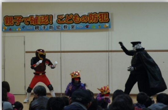
マモルマンに子どもたちも大興奮！