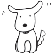
知るぼとキャラクター 矢口イチ (矢口家の愛犬)