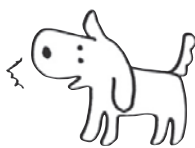
知るぼるとキャラクター 矢口イチ (矢口家の愛犬)

マイナンバーカードの普及促進に向けて、2021(令和3)年3月からマイナンバーカードが健康保険証として利用できるようになりました(利用には、事前にマイナポータルで申込みが必要です)。医療機関や薬局の受付でマイナンバーカードをカードリーダーにかざすだけで、ICチップ内の電子証明書により医療保険の資格などをオンラインでスムーズに確認できるようになりました(12桁のマイナンバーは使われません。また、医療機関や薬局の受付窓口でマイナンバーを取り扱うこともありません)。健康保険証の場合は、引越しをすると住所の変更手続きが必要だったり、転職をすると切替えが必要だったりしますが、マイナンバーカードの場合はそういった手続きを踏むことなく受診できるというのもメリットです。