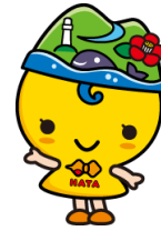
はたっぴー（幡多広域観光イメージキャラクター）