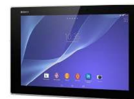
タブレット(10.1インチ, 防水機能)