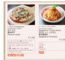
メニューイメージ