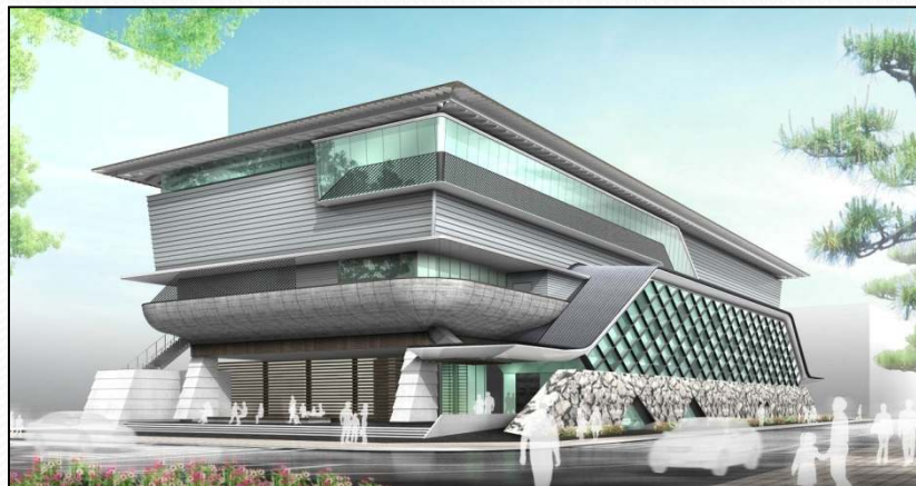
・外観イメージ(追手筋側)