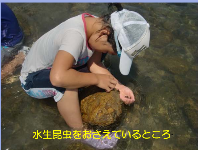
水生昆虫をおさえているところ