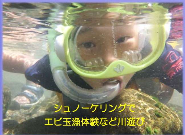
シュノーケリングで エビ玉漁体験など川遊び