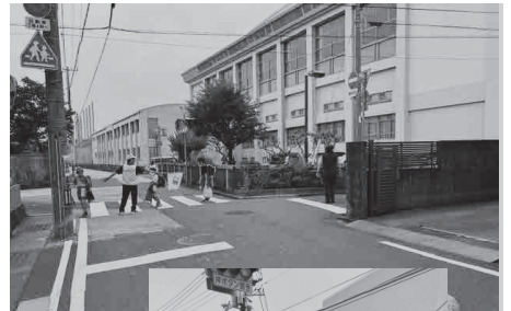
見守り活動の様子