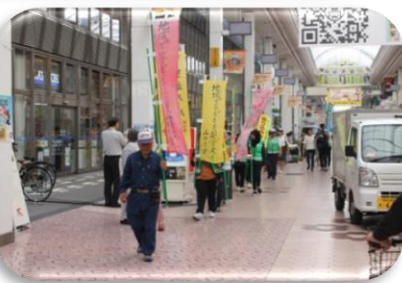
帯屋町商店街を行進する様相