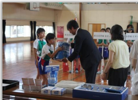
表彰式での副賞贈呈

今大会は今年で43回目の開催。今年は、「CSR活動(企業の社会貢献活動)」に積極的に取り組んでいる、大塚製薬株式会社が初めて協賛することになり、入賞チーム及び個人には、表彰状に加えて、同社徳島支店高知出張所長から副賞が贈られました。