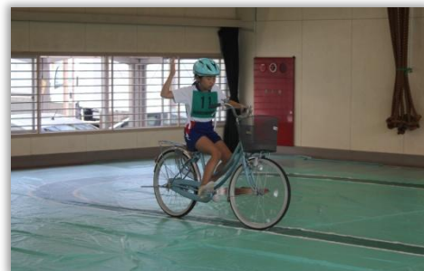
技能走行テストの模様

種目は、安全走行テストと技能走行テストの実技と学科テストで、県内の小学校3校から、5チーム、計20名の選手が出場し、日頃培った技と知識を競いました。