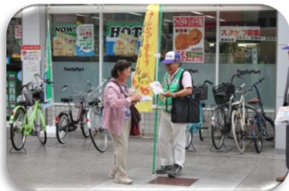
キャンペーンの様相

その後に行われた「みのり会」総会では、事務局からの事業報告等の後、安全安心まちづくり担当者が、「高齢者の交通事故防止」をテーマとして講演を行いました。講演後には、「みのり会」と高知県青年団協議会の共同による特殊詐欺の寸劇を実施。老いも若きも熱演して防犯を呼びかけました。