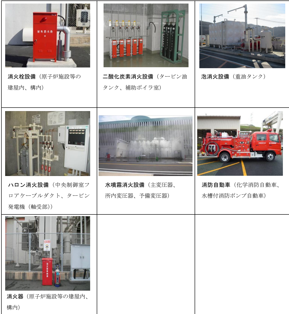
図⑧-1-1 代表的な消火設備