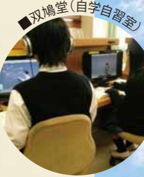
■双鳩堂(自学自習室)