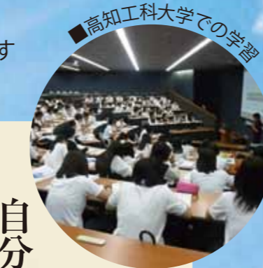
■高知工科大学での学習