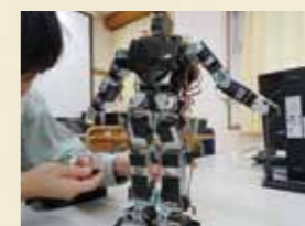
■ロボット制御実習

ロボット制御に関する知識、技術を修得し、数値制御機械、産業用ロボット分野を中心とした企業の中核を担うことができる技術者を育成します。