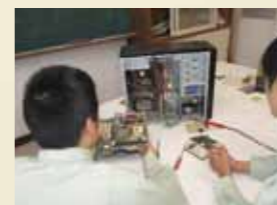
■コンピュータ基礎実習

電子・情報技術に関する知識や技術を修得し、ITやコンピュータ制御・通信の分野を中心とした企業の中核を担うことができる技術者を育成します。