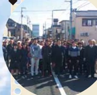
■地域学習(街歩きガイド)