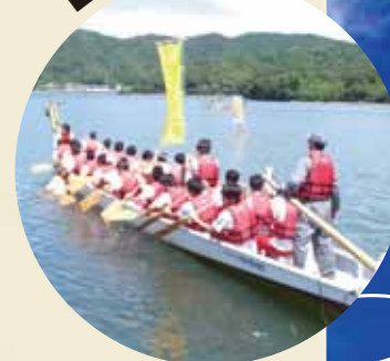
■ドラゴンカヌー大会