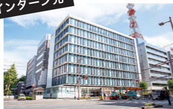
株式会社 高知システムズ 高知市本町4-1-16 高知電気ビル ☎088-826-7003

1987年に誕生した「高知システムズ」は、社会インフラを支える情報・通信システムを開発する企業。情報セキュリティやクラウドサービスの分野でもサービスを展開している。