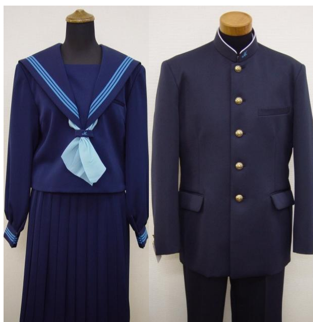
高知南中高等学校の制服