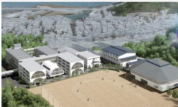
(イメージ図：敷地は現在の須崎工業高等学校)