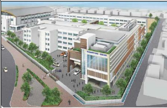
(イメージ図：敷地は現在の高知西高等学校)