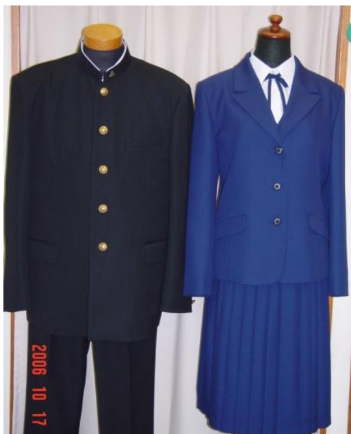
高知西高等学校の制服