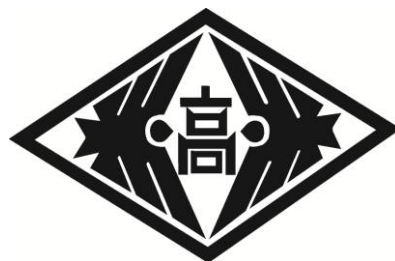
【須崎工業高等学校校章】

平和のシンボルである鳩が向かい合った「双鳩」が、羽ばたいている様子を図案化。なお、この双鳩には、男女共学の理念も込められている。