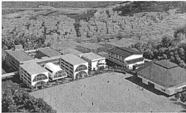
(イメージ図：敷地は現在の須崎工業高等学校)