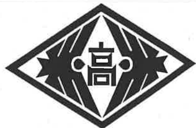
【須崎工業高等学校校章】

平和のシンボルである鳩が向かい合った「双鳩」が、羽ばたいている様子を図案化。なお、この双鳩には、男女共学の理念も込められている。