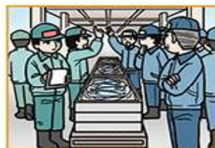
陸揚げ地【登録必須】