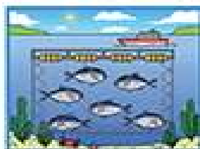
養殖場等【登録必須】