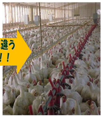
土佐はちきん地鶏の鶏舎