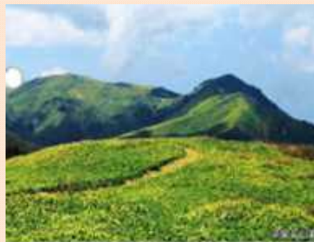
平家平パノラマトレッキングコース