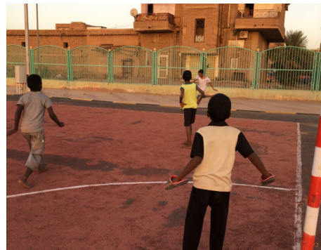
ユースセンターにて。裸足、キーパーは手にサンダル！

このように、女性・女の子のスポーツに対して保守的なスーダンの中でも、スポーツの重要性に理解を示し積極的に取り入れようとしてくれるおばあちゃん校長先生や、女性のあなたからスポーツの素晴らしさを伝えて欲しい、スポーツの場面では性別は関係ない、と協力してくれるスーダン人男性コーチたちもおり、彼らのサポートのおかげでこのような活動ができています。これからも少しずつ活動をひろげ、誰でも当たり前にはスポーツができる環境づくりのお手伝いをしていきます。