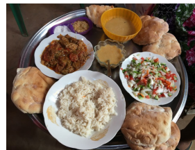
昼食。数人で囲んで食べます。男女別