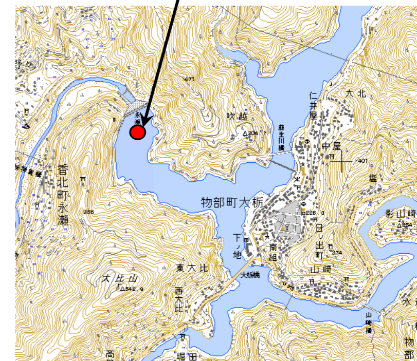
▲永瀬ダム周辺 位置図