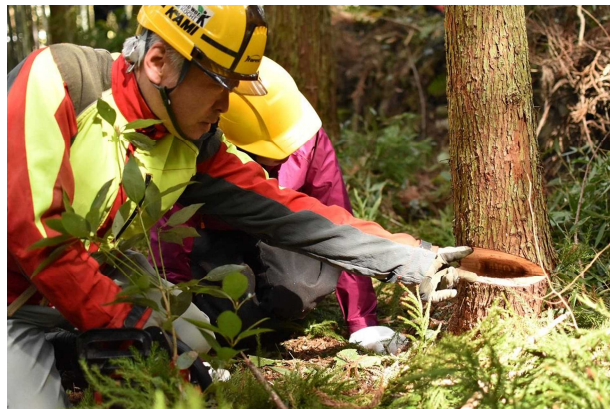
山師から指導を受ける参加者