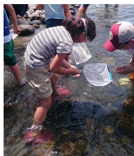
かわ 川でいきものをとって