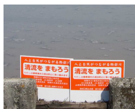
しすいばん 止水板