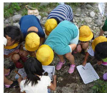
しら 調べているようす