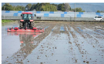
あさみずしろ 浅水代かきのようす