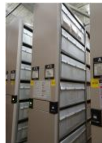
現在の公文書の保存状況

歴史的公文書等を保存するため、既存の書架を使用するほか、新たに閉架書庫を整備して、施設の残存耐用年数約 30 年以上にわたって資料を保存可能な書架延長（約 6 km）を確保します。