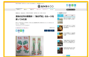
高知家の〇〇「紙の門松」のルーツを探ってみた話

地上波をはじめとしたテレビ番組タイアップ企画により、広い層に対する情報拡散を図ります。