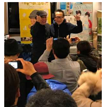
吉田類さんトークイベント