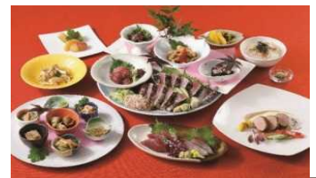
秋のコースメニュー