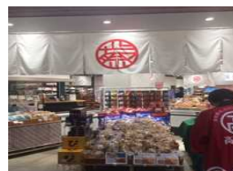
しなまつり(名古屋 高知屋)