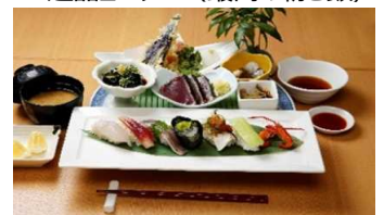
にぎり鮨の彩り皿鉢