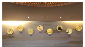
「アクトランド」プロデュースパネル