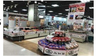
イトヨーカドーアリオ橋本「高知フェア」