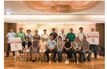
「関東海援隊」感謝状贈呈式