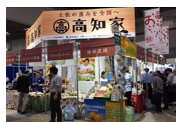
第11回居酒屋産業展