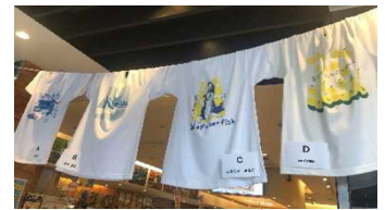
「WE LOVE 高知」

高知県内で開催されている「志国高知 幕末維新博」と連動し、4月の県立坂本龍馬記念館のオープンに合わせて「やっぱり龍馬が好き！」と題し、香南市にある「アクトランド」プロデュースのパネルを2階レストランの壁に設置し、物販では龍馬グッズの特設販売を行いました。