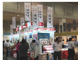
フードストアソリューションズフェア2018