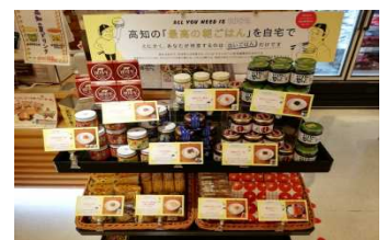
逸品コーナー（最高の朝ご飯）

しんじょう君来店イベント、生姜の日イベント、まるごと高知8周年大抽選会、地ビール有料試飲会、銀座のアンテナショップ連携酒まつり、まるごと高知酒まつり、高知防災グッズフェア等多数開催