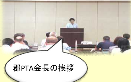
PTA・教育行政研修会(吾川地区)