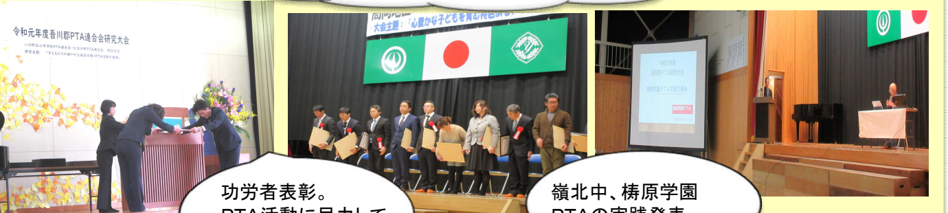
功労者表彰。 PTA活動に尽力して いただいています。