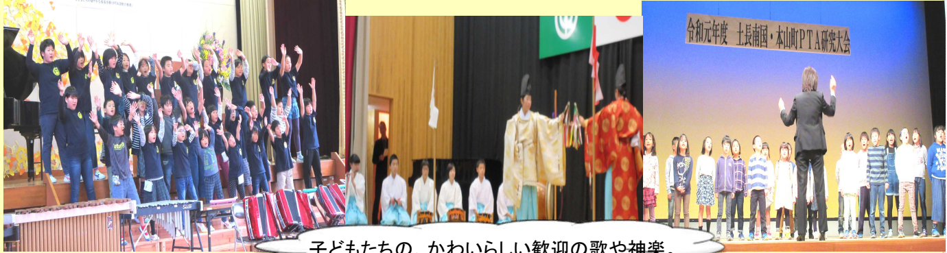
子どもたちの、かわいらしい歓迎の歌や神楽。

中部管内を吾川・土長南国・高岡の3地区に分け、PTA研究大会が開催されました。それぞれ子どもたちの歌などの歓迎行事の後、功労者表彰や地区PTAの実践発表などもありました。また、著名な講師を招いての講演会も開かれ、大変勉強になったという声が聞かれていました。