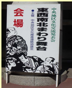
写真は、昨年の第37回東西南北まわり舞台(高知市中山間地域構造改善センター)の様子