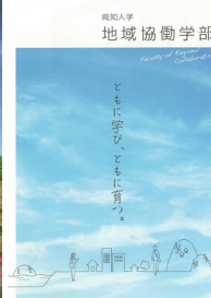
写真は 右 高知大学 地域協働学部 左 高知県立大学 域学共生 のパンフレット