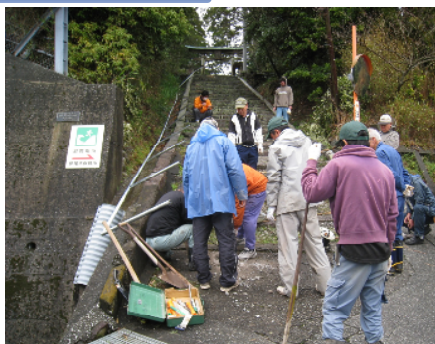
自主防災組織による避難路整備 (安芸市)