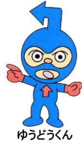
ゆうどうくん 高知県防災キャラクター © やなせたかし