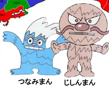
つなみまん じしんまん