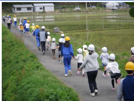
学校での避難訓練 (四万十町立興津小学校)