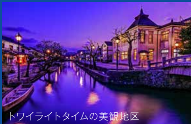
トワイライトタイムの美観地区