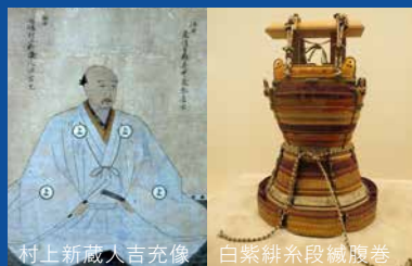
村上新蔵人吉充像