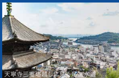
天寧寺三重塔越しに見る尾道水道