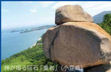
神が宿る巨石「重岩」(小豆島)