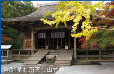
第31番札所五台山竹林寺