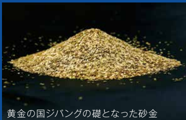
黄金の国ジバングの礎となった砂金