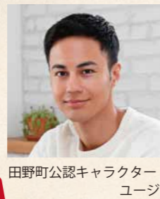
田野町公認キャラクター ユージ