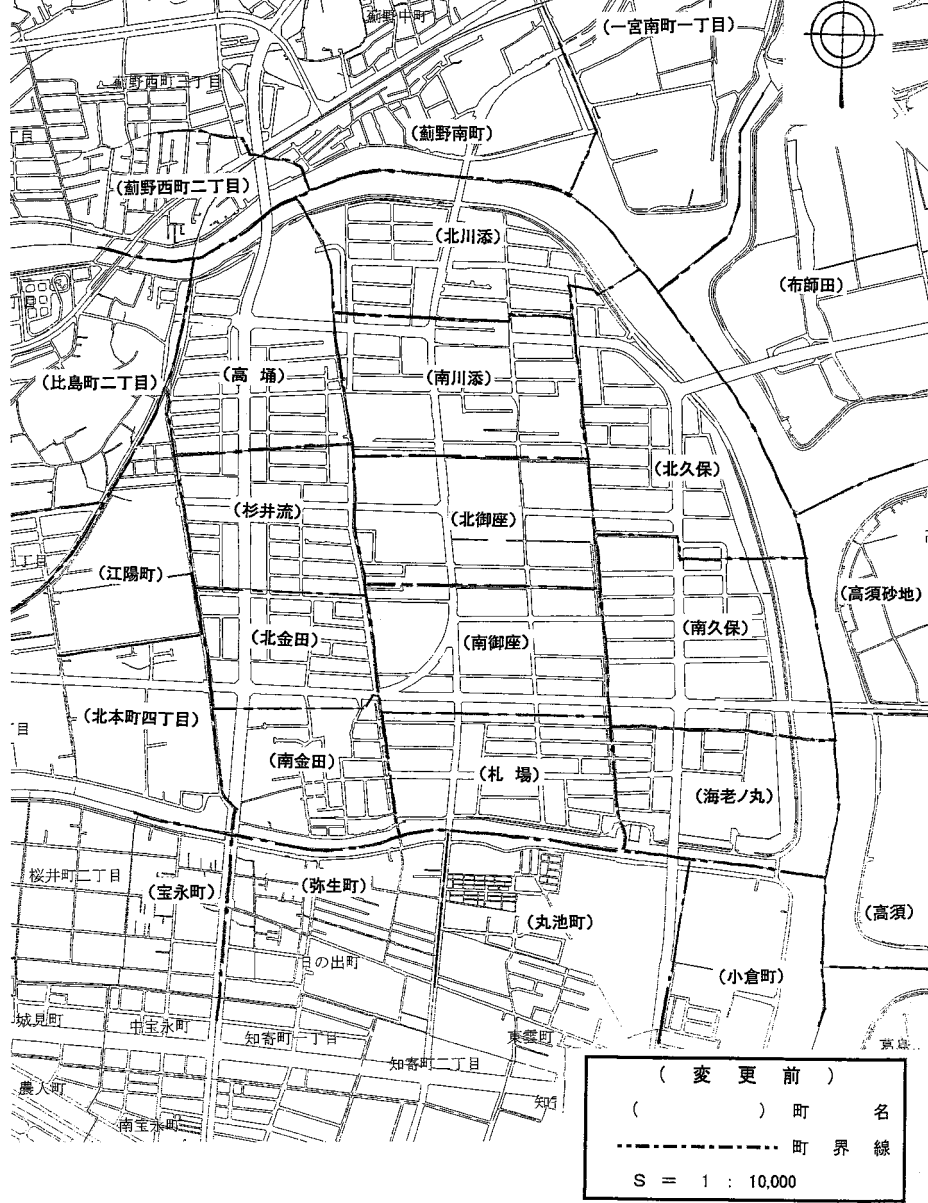
別図1 変更前の区域