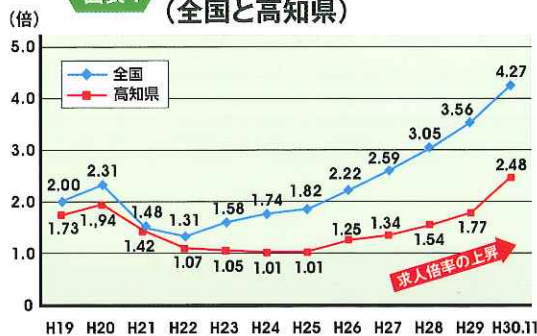
図表4 介護分野での有効求人倍率（全国と高知県）