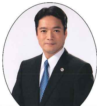
高知県知事 尾崎 正直