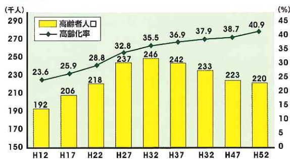
図表1 高齢者の将来推計人口（高知県）