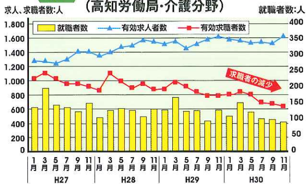
図表3 求人・求職・就職者数の推移（高知労働局・介護分野）

また、平成37年には1,064人の介護人材の不足が見込まれるなど、介護人材の確保に向けて早急な対策が求められています。