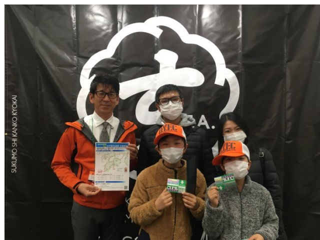
▲中平宿毛市長から56枚限定の開通PRステッカーを配布し、高速道路を利用したの宿毛湾への釣行を売り込み 来場者の声：『高速道路を利用して宿毛に遊びに行きたい！』『延伸した高速道路を利用し、今年も釣りに行きたい！』