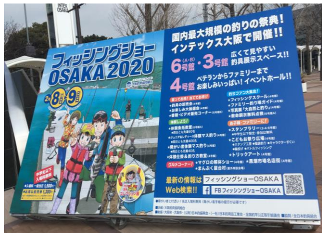
▲開催期間中に約5万人が来場した フィッシングショーOSAKA2020

令和2年2月7日(金)～9日(日)に、インテックス大阪(大阪市住之江区)で開催された「フィッシングショーOSAKA2020」において、(一社)宿毛市観光協会と連携して、中村宿毛道路の来年夏頃の全線開通をPRしました。