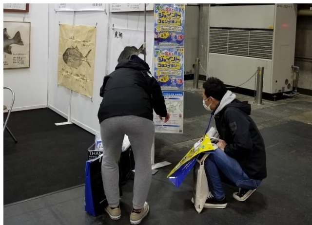
▲高速道路の整備状況を見入る来場者 高速道路の早期開通を望む声が聞かれました