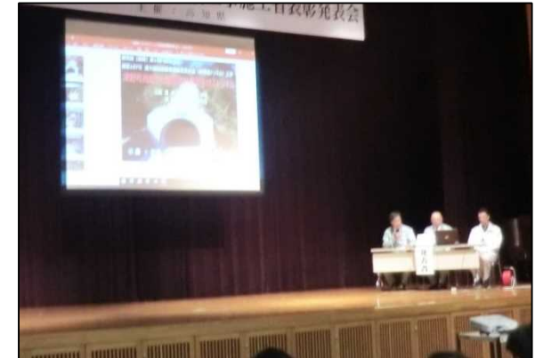
株式会社轟組 株式会社田邊建設 杉本土建株式会社