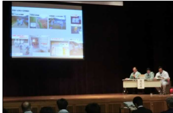
青木建設株式会社