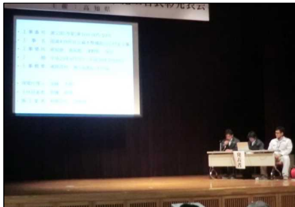
有限会社高橋建設