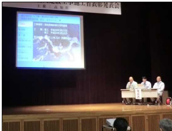
株式会社龍生 月灘建設株式会社