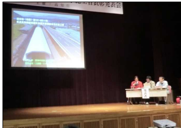
株式会社三谷組 ミタ二建設工業株式会社