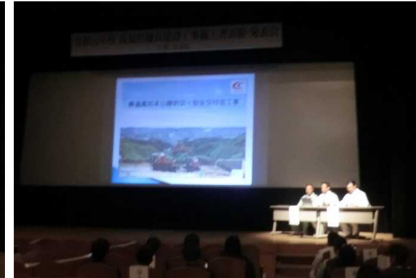
福留開発 株式会社 関西新洋米村 株式会社