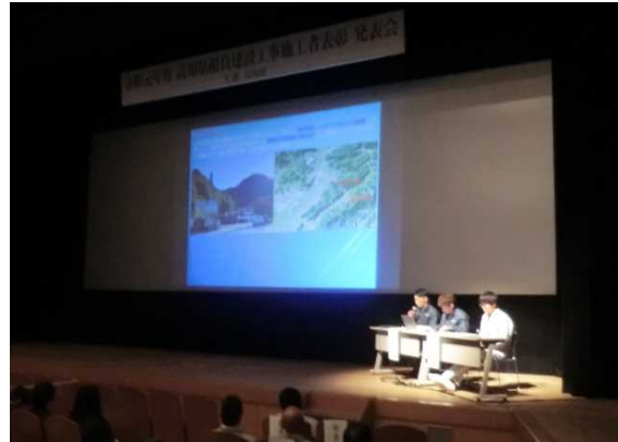
有限会社 武政建設