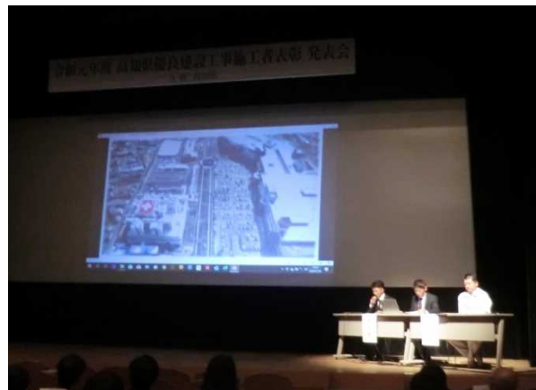
株式会社 三谷組 株式会社 轟組