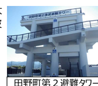
田野町第2避難タワー

【事業費】 3,064百万円 【対象箇所・実施期間】 南国市前浜 ほか22箇所 (H24～H28)