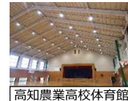
高知農業高校体育館

学校体育館の避難所機能を維持するよう、県立学校体育館の非構造部材等の耐震化を実施