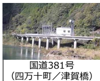
国道381号 (四万十町/津賀橋)