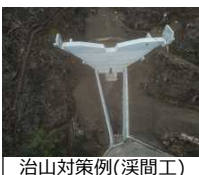
治山対策例(溪間工)

【対象箇所】 ・治山事業等 大豊町西庵谷 ほか24箇所 ・森林整備事業 ・林道改良事業等 間伐面積1,750ha 亀谷小石川線 ほか15箇所