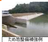
ため池整備補強例

【対象箇所】 ・南国市中部1期地区 ほか15地区 【3か年事業費】3,159百万円