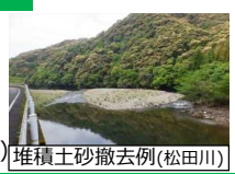
堆積土砂撤去例(松田川)

【対象箇所】 ・物部川 ほか65箇所 【R2事業費】 822百万円 (R元比3.8倍)