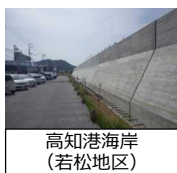
高知港海岸 (若松地区)