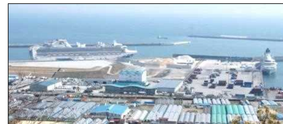
H31.4 クルーズ船2隻同時接岸